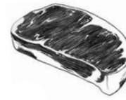
NEW YORK STRIP STEAK