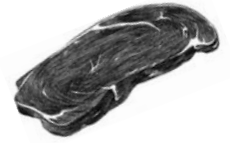
LADY STEAK ANGUS