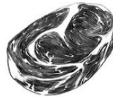
BLACK ANGUS RIB EYE